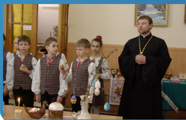
Радополія 5 класу

12 квітня долучилися до свята, п'ятикласки, провівши тематичну лінійку «Великдень в Україні». Існує декілька легенд щодо виникнення назви свята. За однією з них назва «Великдень» («Великий День») з'явилася аж наприкінці першого тисячоліття з приходом на українську землю християнства. На початку лінійки діти розповіли про Вербну неділю. У цей день Ісусу Христу увійшов до Єрусалиму, усі люди вклонялися йому та клали пальмові гілки йому під ноги. В Україні пальми не ростуть. Тому у Вербну неділю ми святимо саме вербу. Потім учні показали міні-виставу «Приготування української родини до Великодня». Не забули п'ятикласники розповісти приказки та легенди, пов'язані з цим святом. Особливу увагу діти приділили писанкам, крашанкам, дряпанкам, які вони виготовили власними руками. Закінчилася лінійка промовою отця Андрія, який привітав всіх людей з Великоднем і нагадав, що всі мають веселитися, бо хто буде сумувати в цей день, сумуватиме і весь рік.