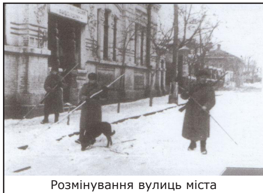
Розмінування вулиць міста

8 січня – особливий день для всіх жителів Кіровоградщини. Саме в цей день у 1944 році обласний центр було звільнено від німецько-фашистських загарбників.